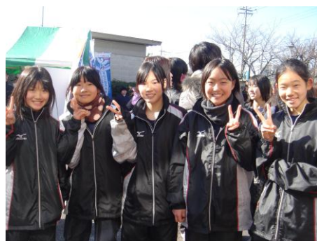
神代中陸上部 (中学生女子)

1月29日、参加250チームが号砲とともに寒風に向かった。たすきを繋ぐために無我夢中で走る者。揃いの制服で楽しみながら走る者。みんなチームの絆を確かめ合い、笑顔で家路に着いたことだろう。