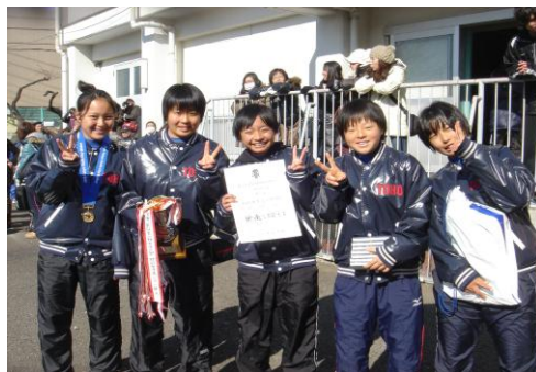
桐朋女子高ソフト部 A (一般女子)