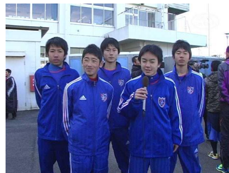
FC東京 U-15A (中学生男子)