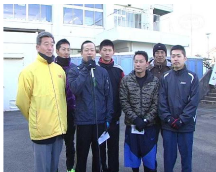
調布消防署 A (一般男子)