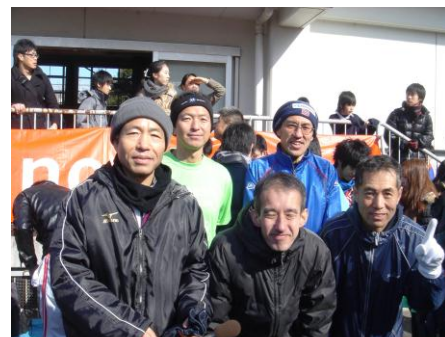
深大寺走友会 A (40歳以上)

1月29日、参加250チームが号砲とともに寒風に向かった。たすきを繋ぐために無我夢中で走る者。揃いの制服で楽しみながら走る者。みんなチームの絆を確かめ合い、笑顔で家路に着いたことだろう。