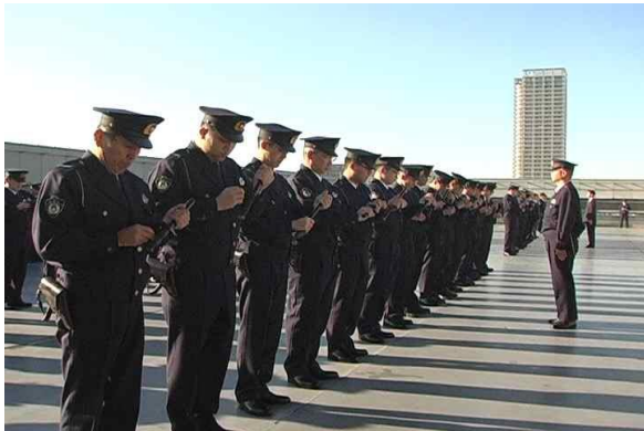
【通常点検】 調布警察署にて

一方、警察と地域との普段からの信頼関係が大事であると署長は話されています。是非お聞きください。