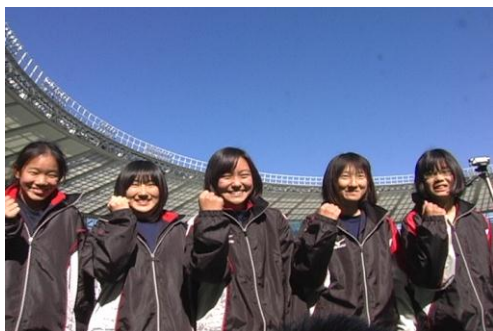
【神代中 A (中学生女子)】