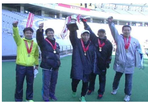
【深大寺走友会 A (40歳以上)】