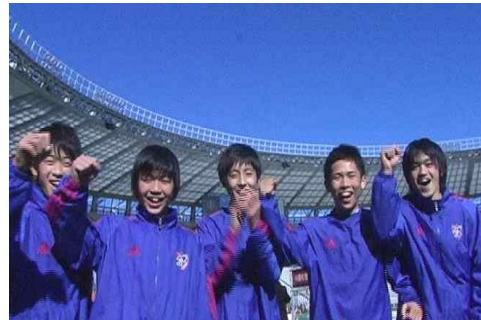
【FC東京 U-15C (中学生男子)】