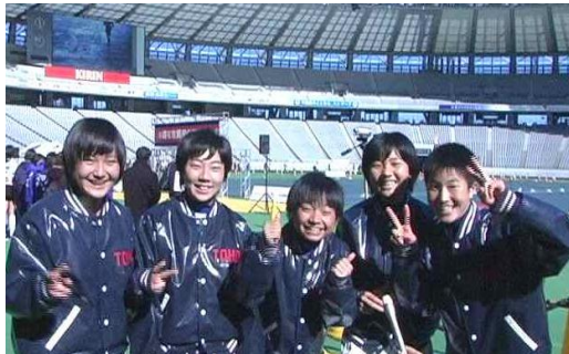
【桐朋女子高ソフト部 A(一般女子)】