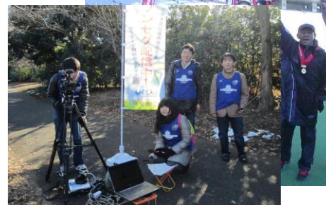
電気通信大学 駅伝でのワンセグの取組みの様子 関連記事:3面