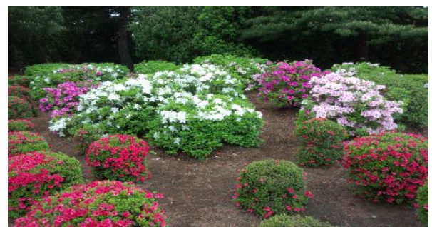
神代植物公園のつつじ園