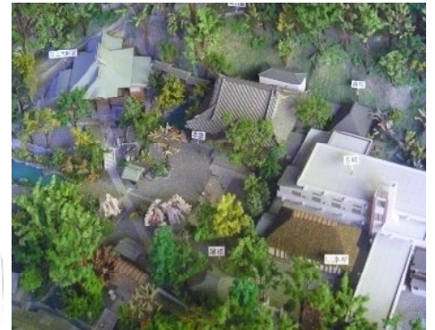
【深大寺周辺の模型】

深大寺地域の景観まちづくり活動に役立つために作られたが、今後はイベントなどにも貸出し、多くの方に実際に見て頂き、実感していただきたいと考えている。